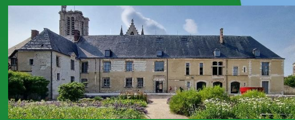
Visite du musée d'Art Moderne le 03 juin 2026 de 9h30 à 12h