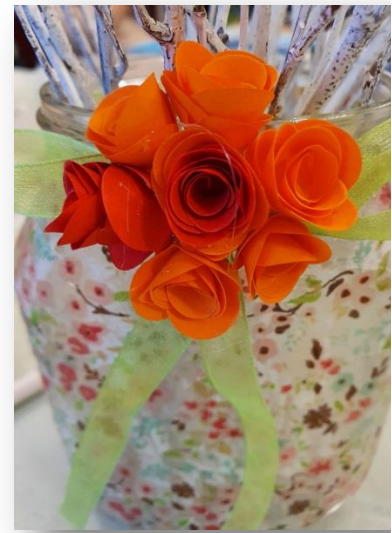
13- Ajouter un ruban et coller des fleurs dessus