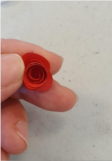
8- Rouler les fleurs entre vos doigts