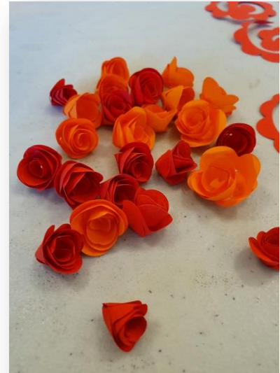
10- Réaliser vos fleurs