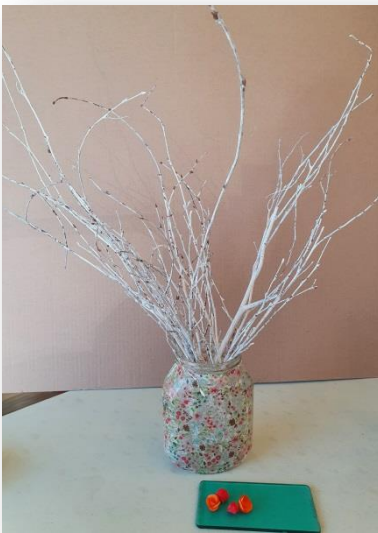
11- Disposer un branchage dans le vase