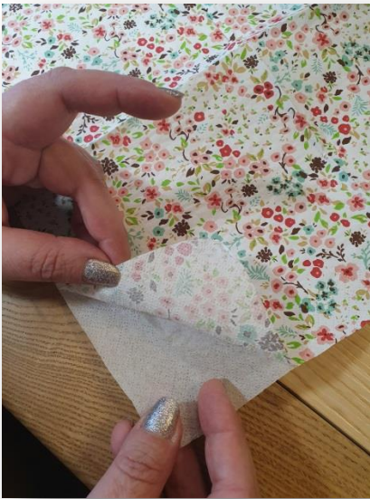
1- Dédoubler la serviette