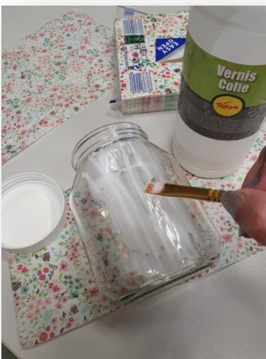
3- Recouvrir le pot de vernis colle