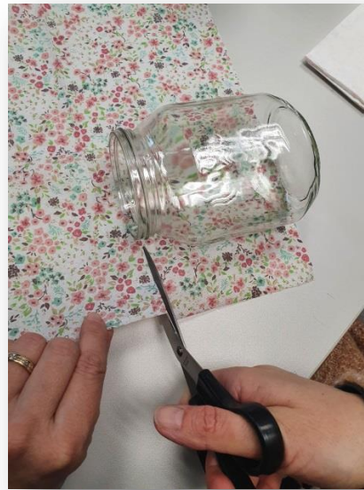
2- Découper une bande de serviette et l'ajuster au pot