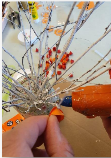
12- Coller les fleurs au pistolet à colle