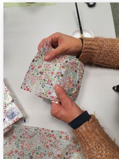
4- Poser délicatement la serviette sur la colle