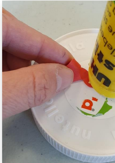
9- Ajouter un point de colle