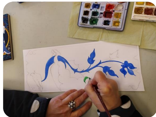
Vous pouvez créer votre dragon