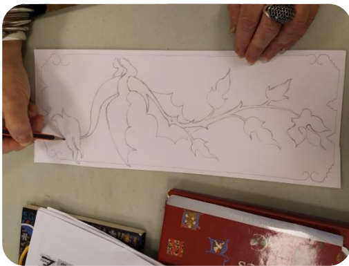
Décalquer ou copier à main levé