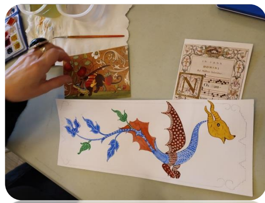
Mettre les rehauts