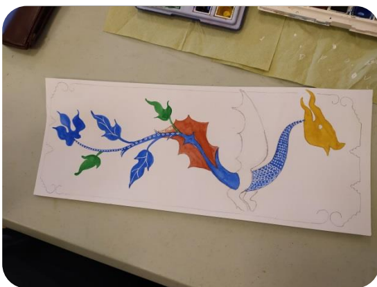
Mettre en couleur