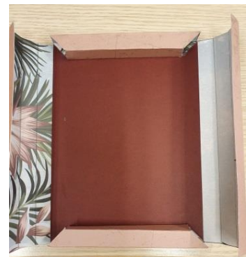
Coller vos bords