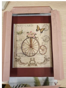
Coller l'image ou la photo