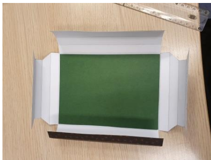
Coller le fond

Si votre photo est plus petite que le cadre prenez une feuille de couleur de 13*18 cm coller la ainsi que le cadre dans l'ordre indiqué